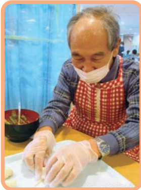
10月は男性が あんこパイを 作っていただきました