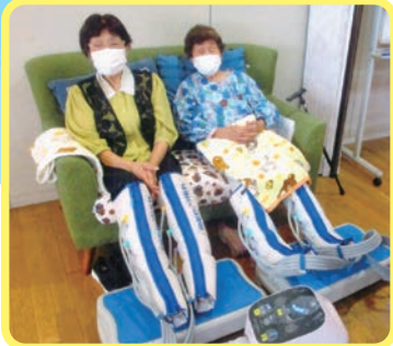
メドマー(空気圧マッサージ)で 血行促進! 気持ち良すぎてウトウト してしまいます