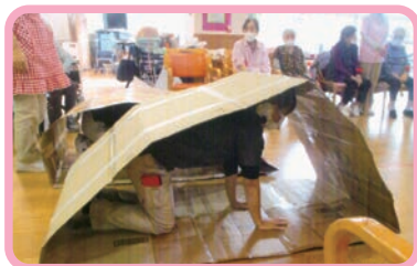
職員によるキャタピラ競争