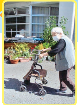
いい気候になり 苑庭で歩行練習