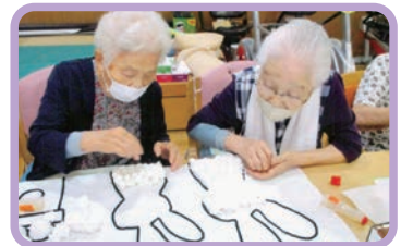
お花紙を丸めて何が できるかな?