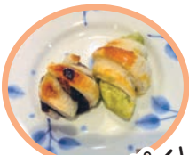
「あんこパイ」の 完成!!