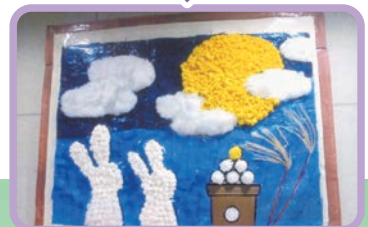
玄関に飾りました