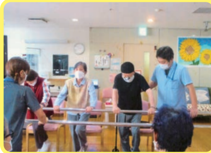
平行棒を使って無理のない様 運動しています