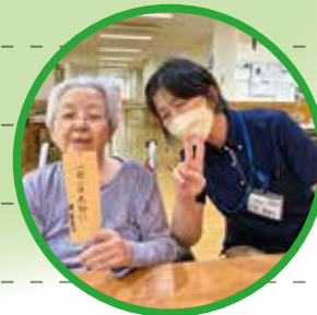
何をお願いしようかな？