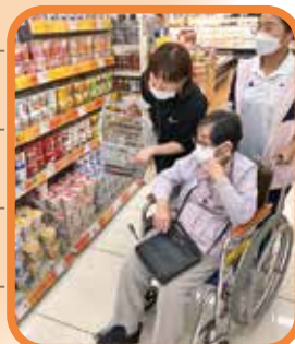
どれにしようかな。

久しぶりのショッピング。自分好みの洋服やお菓子などを見られ、楽しそうに選ばれていました。