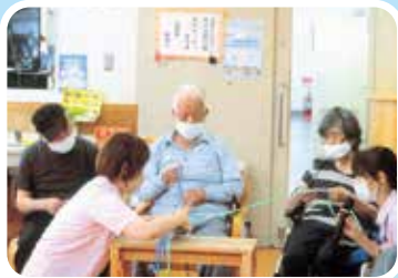
ひもの先には 質問カードが……