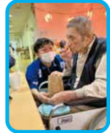
ポテトうまいなあ