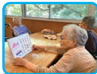
どれにしようかな…