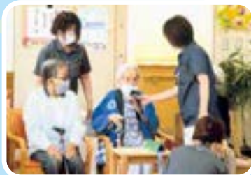
何て書いているかな？