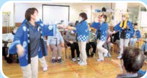
最後は恒例の 炭坑節