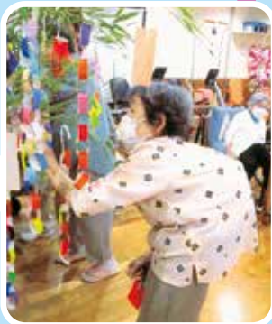
願い事を 書いていただきました