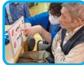
どっちにしようか