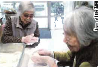
馴れた 手つきで 上手ですね