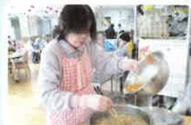
スープに玉子を入れて