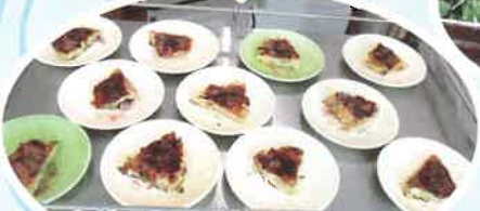
おやつにお好み焼きをして 召し上がって頂きました