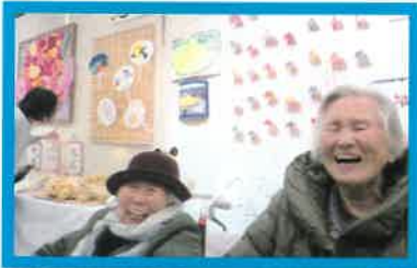
ふれあい作品展にて クリスマス会

レーしながらひとつのタスキを繋ぎゴールを目指すイベントにGHの入居者様と職員メン四天王近くまでタスキを繋ぎ、その後は次の施設へと引継がれました。走者も