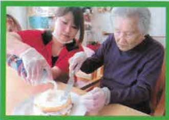
手作りケーキに挑戦!