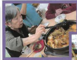
新年会は 鍋パーティをしました