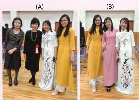
※A ベトナムに赴き、彼女たちに介護の仕事を紹介し和歌山に招致した当苑施設長(右)フロアで彼女たちを母のようにお世話してくれました当苑職員(左)