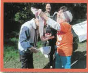
第3走者へつなぎます