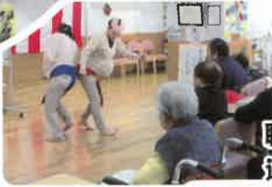
職員の尻相撲は 迫力満点!!