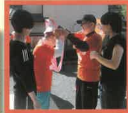
次の走者へつなぎます