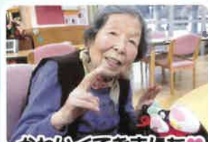
かわいくできました♡