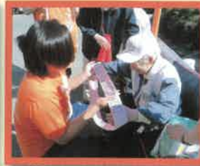
最終ランナーにつなぎます